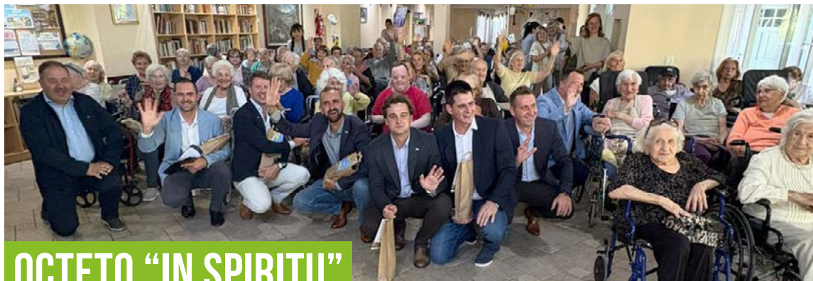
OCTETO "IN SPIRITU"