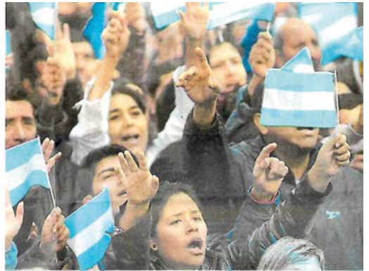
Evangélicos. Cuarenta mil personas de ese credo se reunieron en el Obelisco el 25 de mayo pasado.

unanimidad en el Senado en 1993, pero perdió estado parlamentario al suscitarse el estudio de la última reforma constitucional. Entre las entidades que prestaron su aval se cuenta la Mesa Consultiva de las Federaciones y Asociaciones de Iglesias Evangélicas (ACIERA, FAIE, FECEP, bautistas y adventistas) DAA, AMA, el Centro Islámico, y la Conferencia