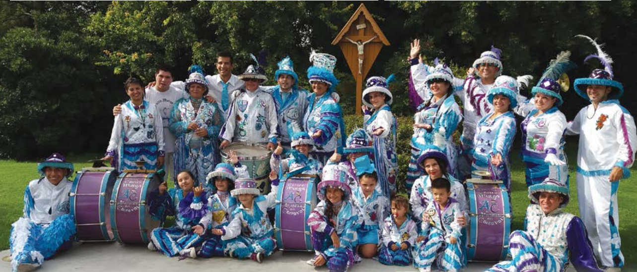
Nos visitó la murga Los afortunados del Carnaval aunque los afortunados hemos sido nosotros, al recibirlos y poder celebrar con tanto color y alegría el carnaval. ¡Gracias murgueros!