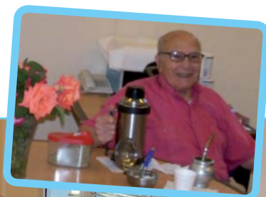
Mate y charlas