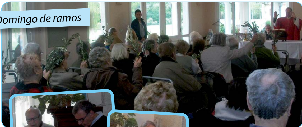
Domingo de ramos

Imágenes de esos momentos especiales de nuestros días corrientes y también los días especiales !