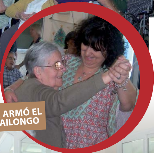
SE ARMÓ EL BAILONGO