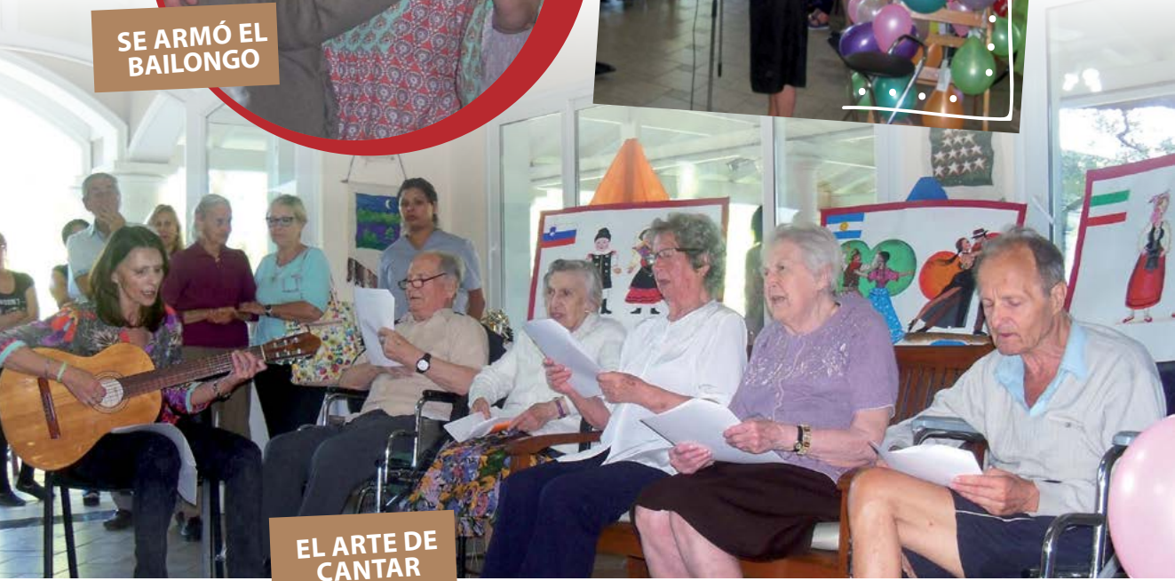
EL ARTE DE CANTAR