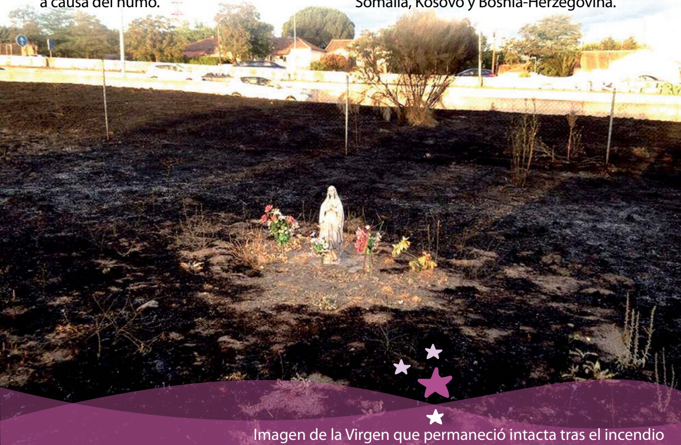
Imagen de la Virgen que permaneció intacta tras el incendio

La relación entre ésta base militar y la Virgen tiene historia. El año pasado este batallón recibió el XXI Premio de la Paz a los Valores Humanos concedido por la Hermandad Nuestra Señora de la Paz en mérito a las operaciones de paz que ha realizado desde hace 20 años en lugares como El Líbano, Irak, Haití, Guatemala, Mali, Somalia, Kosovo y Bosnia-Herzegovina.