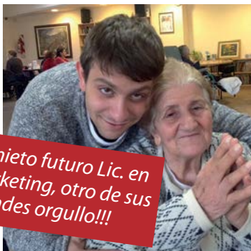
Su nieto futuro Lic. en Marketing, otro de sus grandes orgullo!!!